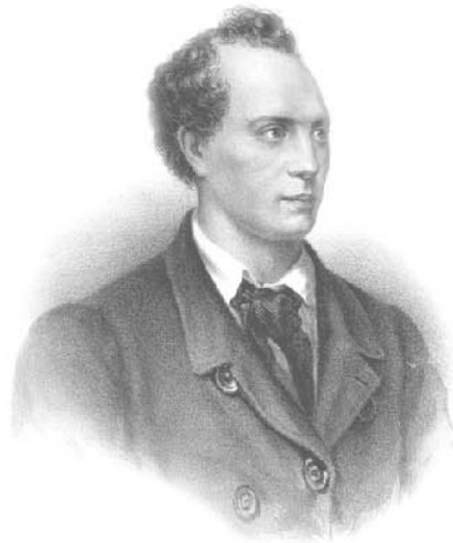
Евгений Абрамович Баратынский (1800–1844)