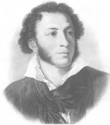
Александр Сергеевич Пушкин (1799–1837)