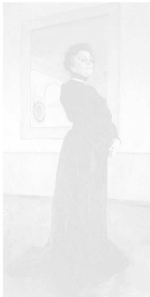
Портрет Марии Ермоловой