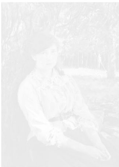
Девушка, освещённая солнцем