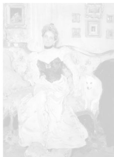
Портрет княгини З. Юсуповой