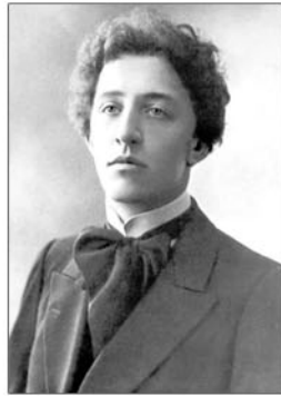
Александр Александрович Блок (1880–1920)