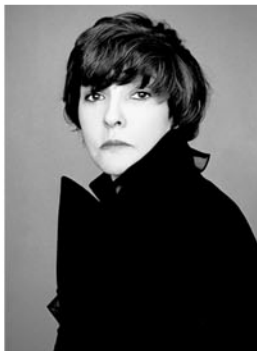
Белла Ахатовна Ахмадулина (1937–2010)