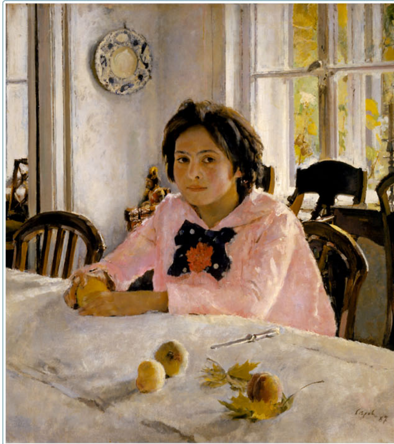
«Девочка с персиками» Валентин Александрович Серов